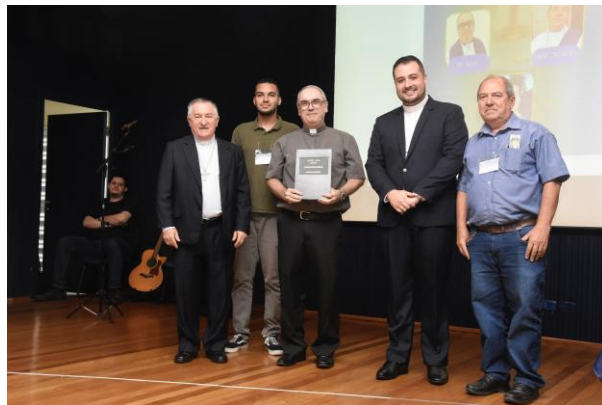
9 - Comissão Diocesana para a cultura e educação.