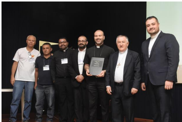
2 - Comissão Diocesana para o laicato.