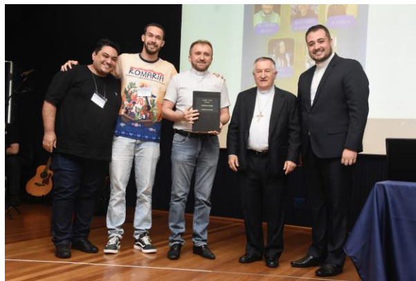
10 - Comissão Diocesana para a juventude.