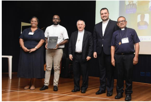
8 - Comissão Diocesana para a animação bíblico-catequética.