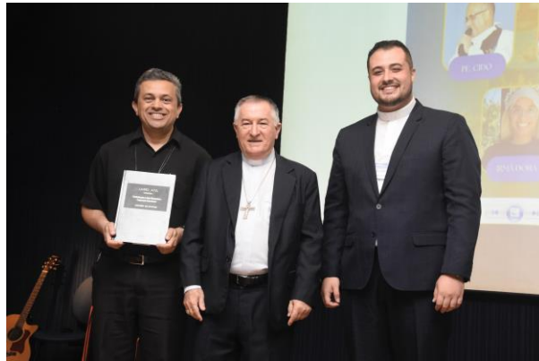
7 - Comissão Diocesana para a ação missionária e cooperação intereclesial.