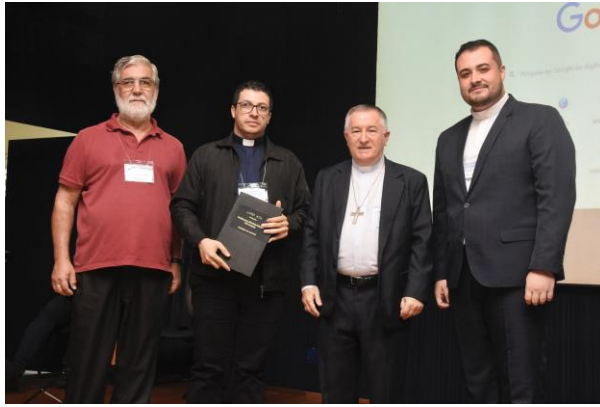
1 - Comissão Diocesana para os ministérios ordenados e a vida consagrada.