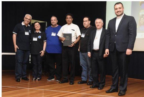
6 - Comissão Diocesana para a vida e a família.