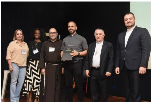
3 - Comissão Diocesana para a pastoral litúrgica.