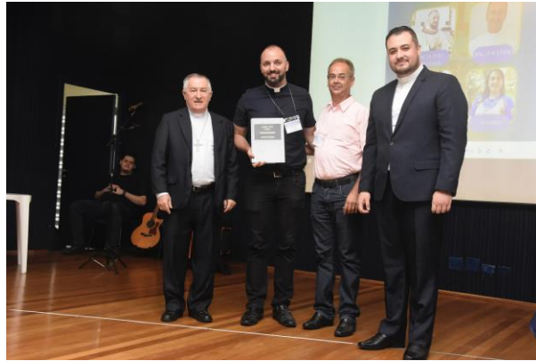
5 - Comissão Diocesana para a comunicação.